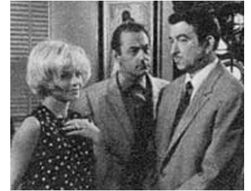
1964 PÉRIL AU PARADIS d'Edmond T. Gréville avec Sophie Hardy, Armand Mestral