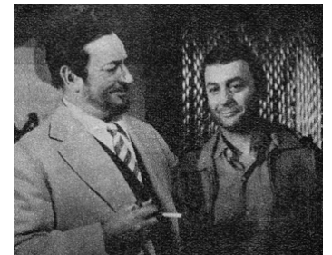
1965 PAS DE PANIQUE de Sergio Gobbi avec Pierre Brasseur