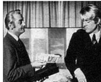
1967 LE BAL DES VOYOUS de Jean-Claude Dague avec Michel Le Royer