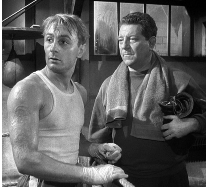
1954 L'AIR DE PARIS de Marcel Carné avec Jean Gabin