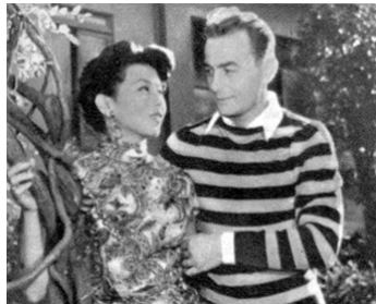
1955 LA JEUNESSE AUX PIEDS NUS (Fukuaki no seishun) de S. Taniguchi avec Yoko Tani