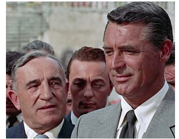
1954 LA MAIN AU COLLET (To catch a Thief) d'A. Hitchcock avec Ch. Vanel, Cary Grant