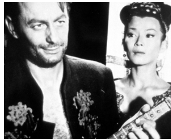
1961 LA FILLE DES TARTARES (Ursus e la ragazza Tartara) de Remigio Del Grosso avec Yoko Tani