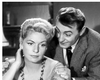
1957 LA BONNE TISANE d'Hervé Bromberger avec Madeleine Robinson