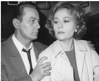
1964 TROIS CHAMBRES À MANHATTAN de Marcel Carné avec Annie Girardot