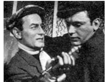
1956 LA LOI DES RUES de Ralph Habib avec Jean-Louis Trintignant