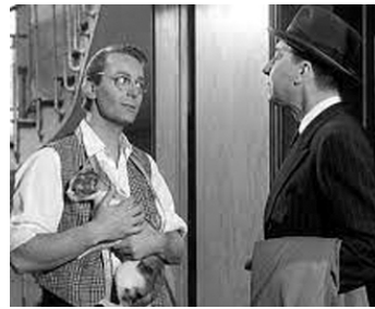
1962 DU MOURON POUR LES PETITS OISEAUX de M. Carné avec Paul Meurisse