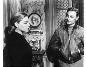
1953 THÉRÈSE RAQUIN de Marcel Carné avec Simone Signoret