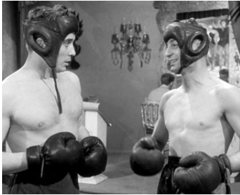
1953 QUAND TU LIRAS CETTE LETTRE de Jean-Pierre Melville avec Philippe Lemaire