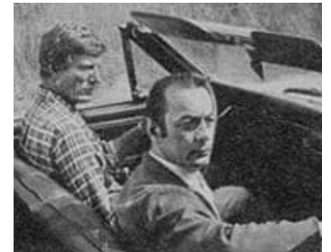
1968 LES ENFANTS DE CAÏN de René Jolivet avec Hans Meyer