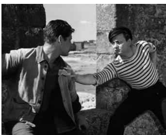
1959 LE 7 e JOUR DE SAINT-MALO de Paul Mesnier avec Alan Scott