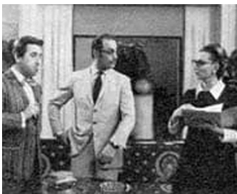
1969 LE BOURGEOIS GENTIL MEC de Raoul André avec Jean Lefebvre, Annie Cordy