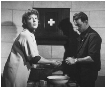
1953 L'AMOUR D'UNE FEMME de Jean Grémillon avec Micheline Presle