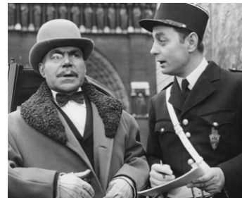
1965 L'OR DU DUC de Jacques Baratier avec Jacques Dufilho