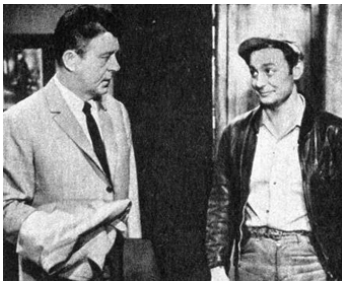
1961 LES MENTEURS d'Edmond T. Gréville avec Jean Servais