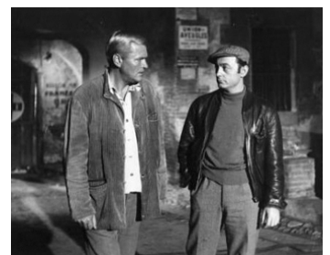
1961 LA FÊTE ESPAGNOLE de Jean-Jacques Vierne avec Peter Van Eyck