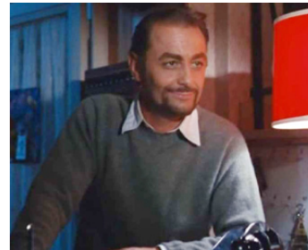
1968 LES JEUNES LOUPS de Marcel Carné