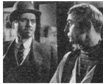
1951 CASQUE D'OR de Jacques Becker avec Claude Dauphin