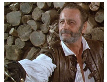
1989 DAMES GALANTES de Jean-Charles Tacchella