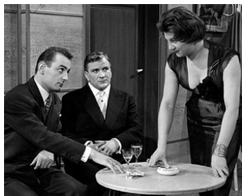
1957 MÉFIEZ-VOUS FILLETES ! d'Yves Allégret avec Pierre Mondy