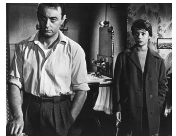
1958 LES TRICHEURS de Marcel Carné avec Pascale Petit